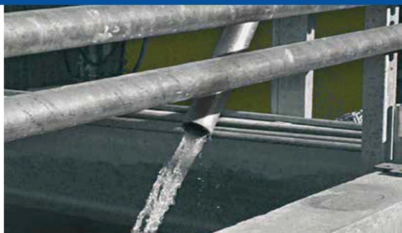
Geklärttes Wasser nach Klärprozess Clarified water after clarification process