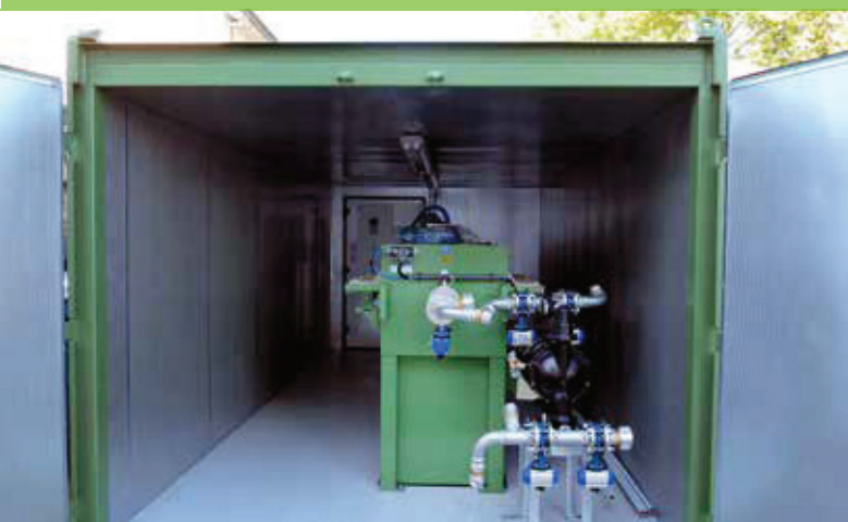
Kammerfilterpresse als mobile Lösung im Container Filter Press as a mobile container solution

With a manual or automatic filter press greywater from the agitator pit can be clarified. As a result clarified water and a semi dry cake is generated.