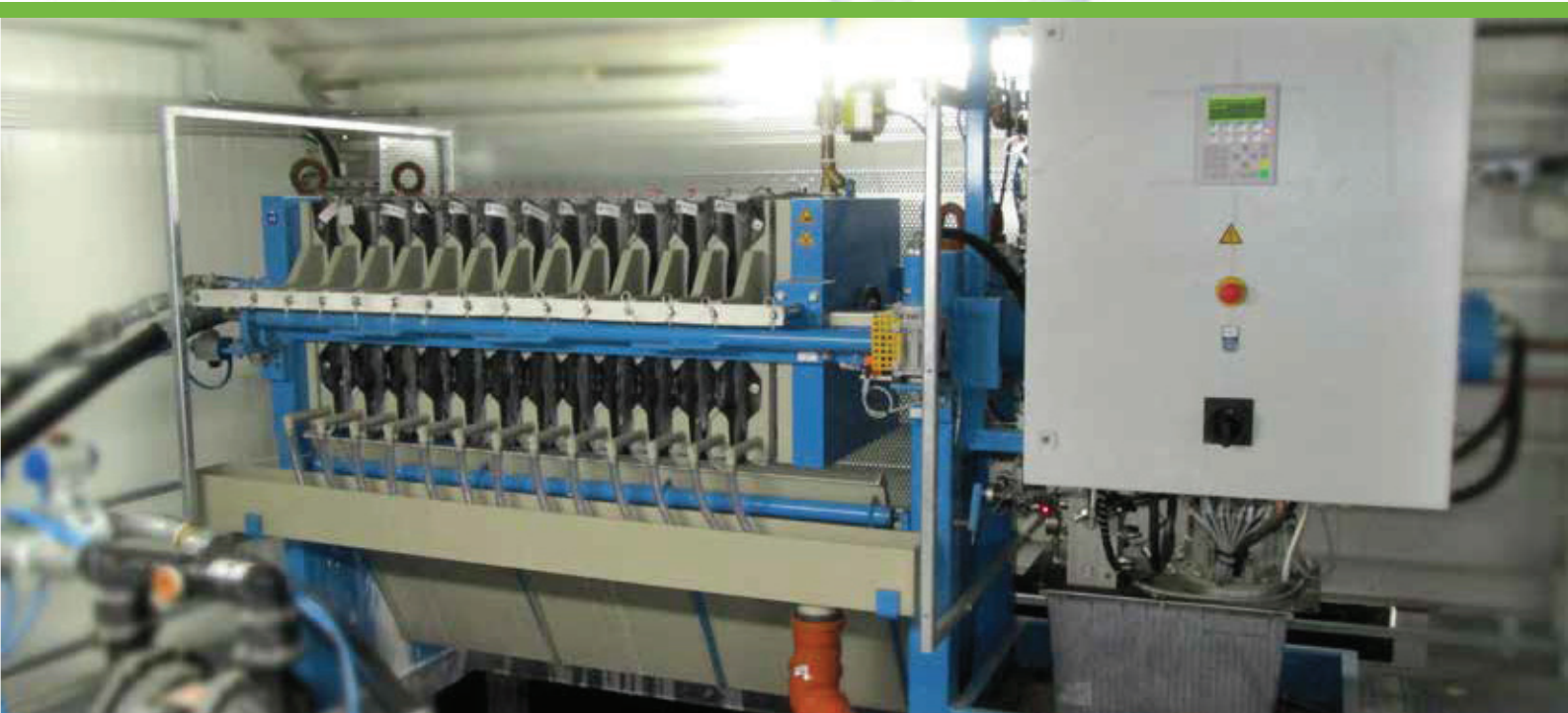
Kammerfilterpresse als mobile Lösung im Container Filter Press as a mobile container solution