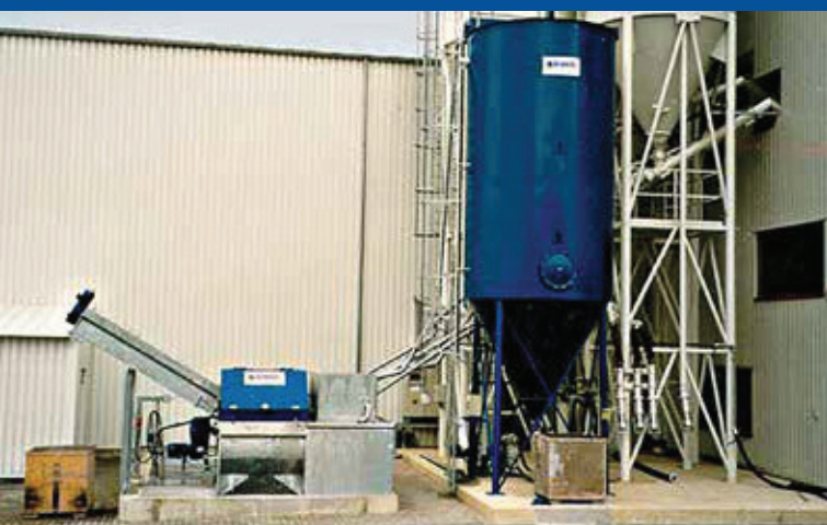
Kläreinheit kombiniert mit Anlage Typ ComTec Clarification unit combined with machine type ComTec

Washing and grinding water can be cleaned in a clarification unit that uses the “Dortmund design principle”. Water is fed into the inner pipe and due to restraint guidance and the effect of gravity the fines are accelerated downwards and clear water upwards, in an outer pipe. A thickener in the lower part of the tower keeps the fines from going hard. The sludge can be pumped away and offers the possibility of being returned to the batching process or further processed through a filter press.